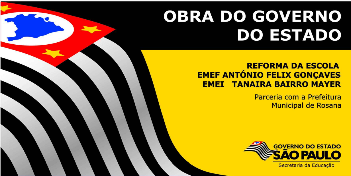
PLACA DE OBRA sem escala